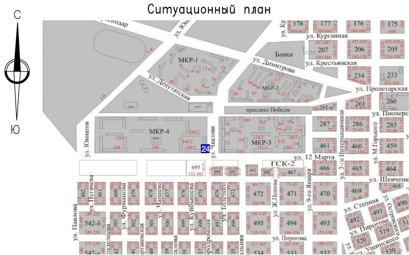
Карта-схема размещения рекламной конструкции N 24 M1:500